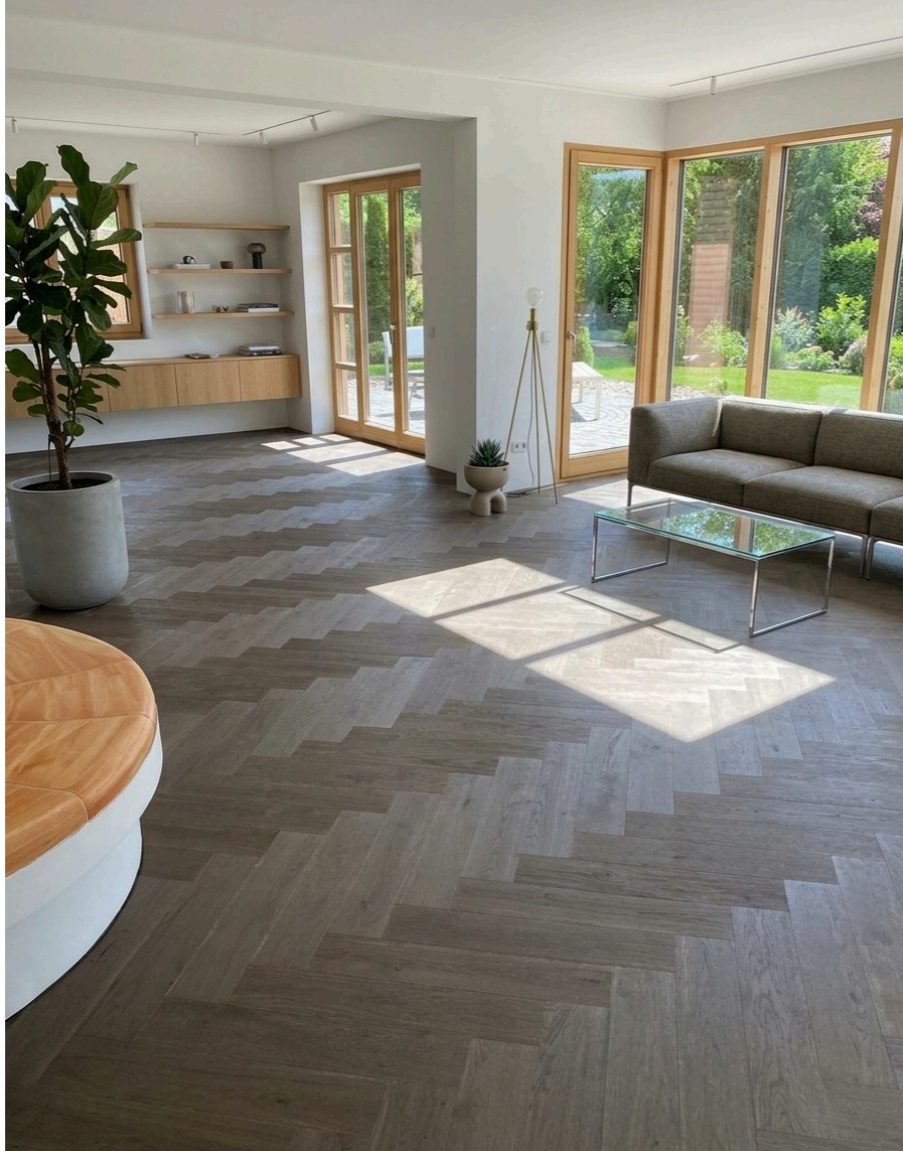
rechts: Top-Line 540 Eiche Shabby Grey oxydativ geölt