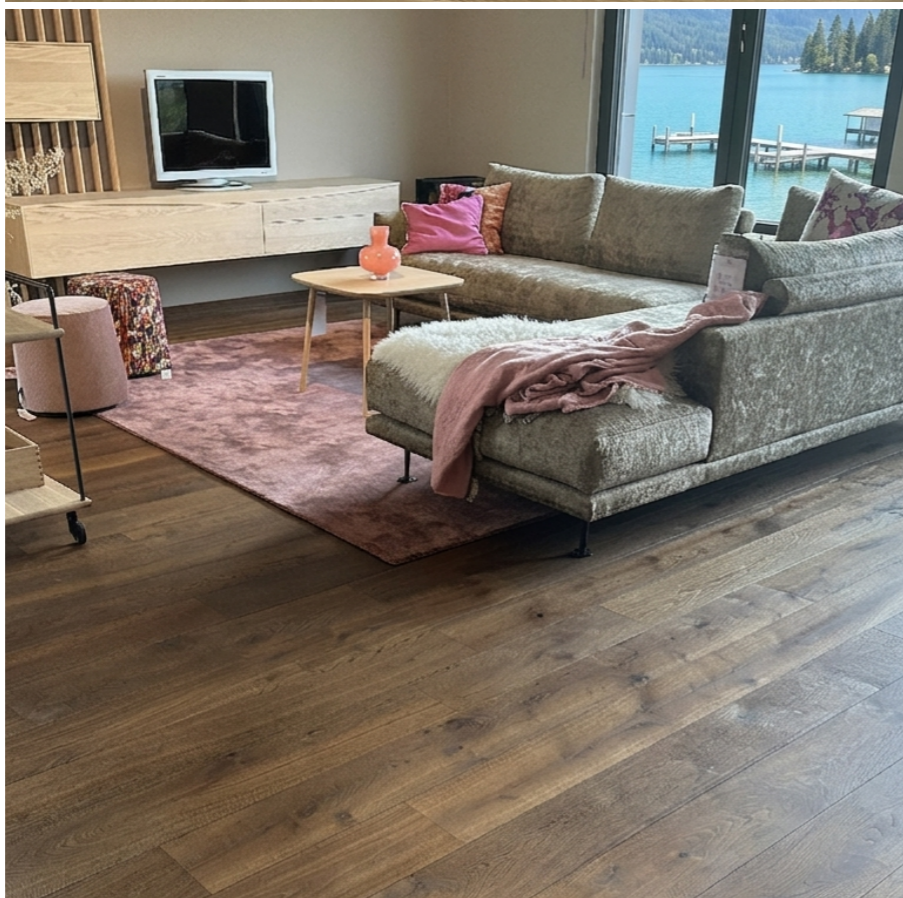
links unten: Amadeus Eiche ?? oxydativ geölt