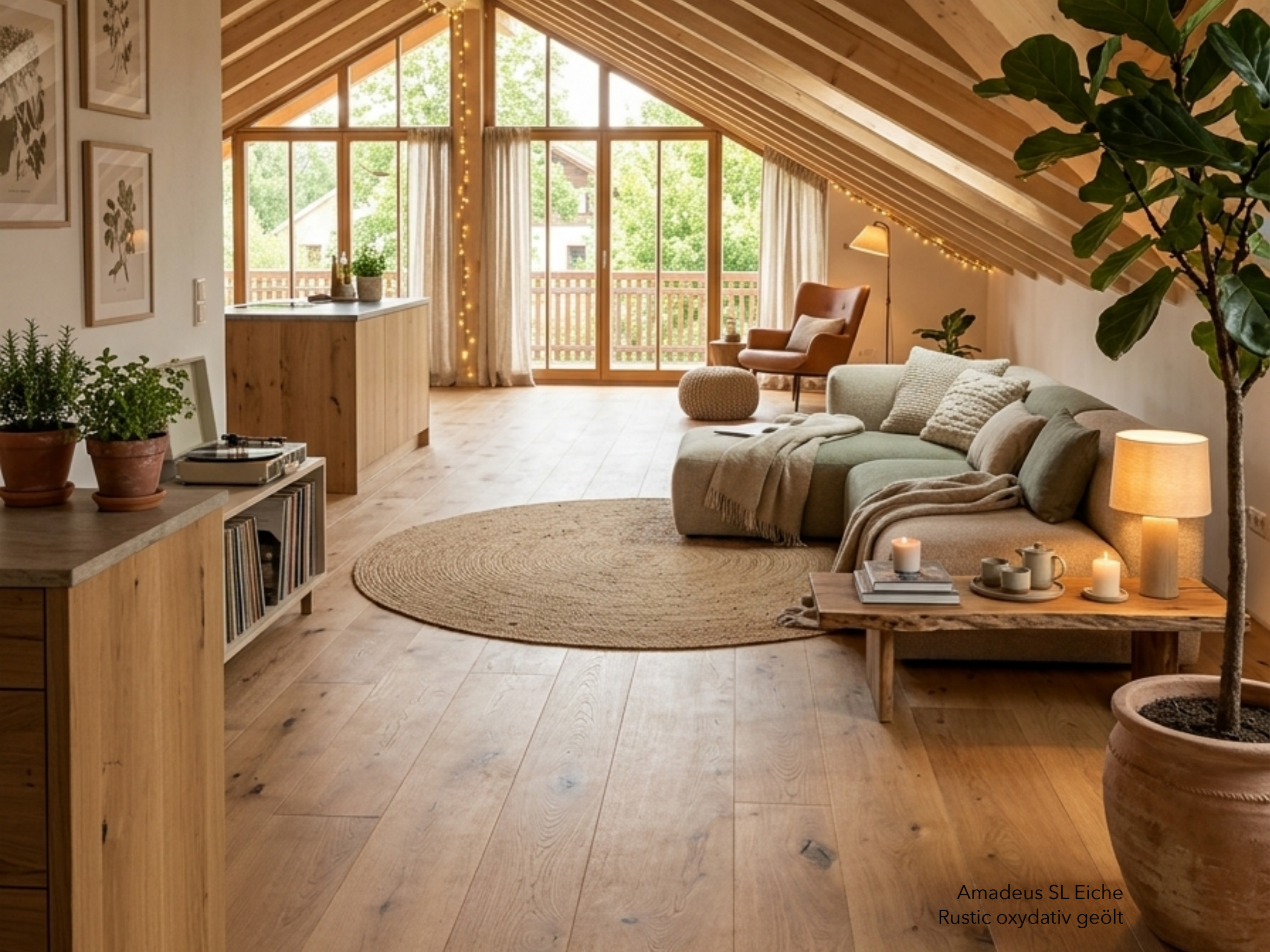
Amadeus SL Eiche Rustic oxydativ geölt