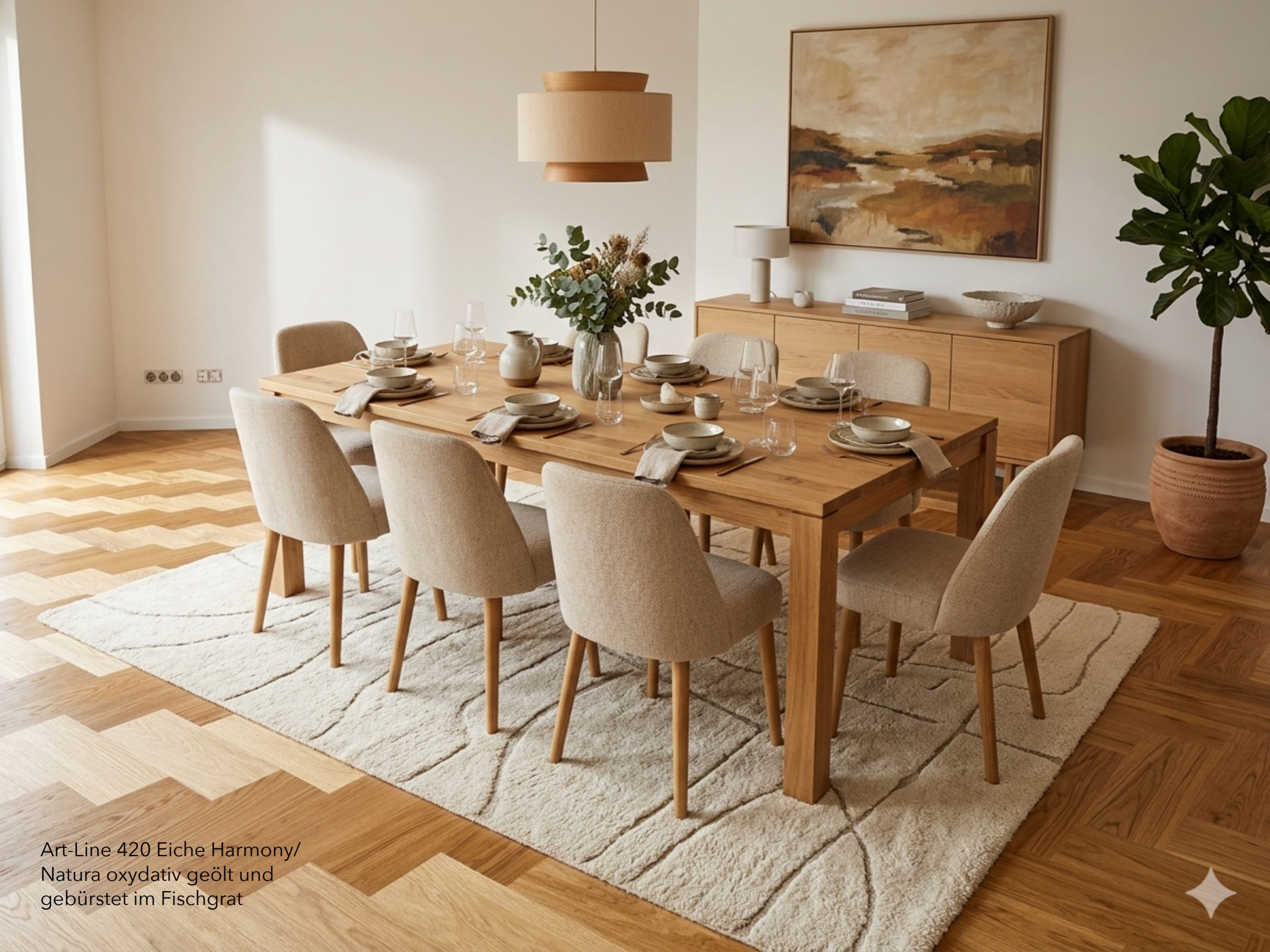
Art-Line 420 Eiche Harmony/ Natura oxydativ geölt und gebürstet im Fischgrat