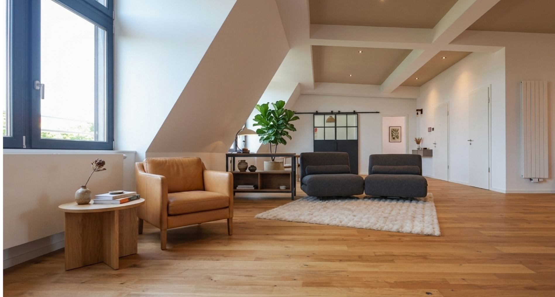
Duo-Line, Top-Line und Country-Line in Eiche Wildlife oxydativ geölt und kombiniert werlegt