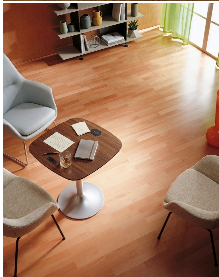
Rechts: Duo-Line Eiche Klassik oxydativ geölt