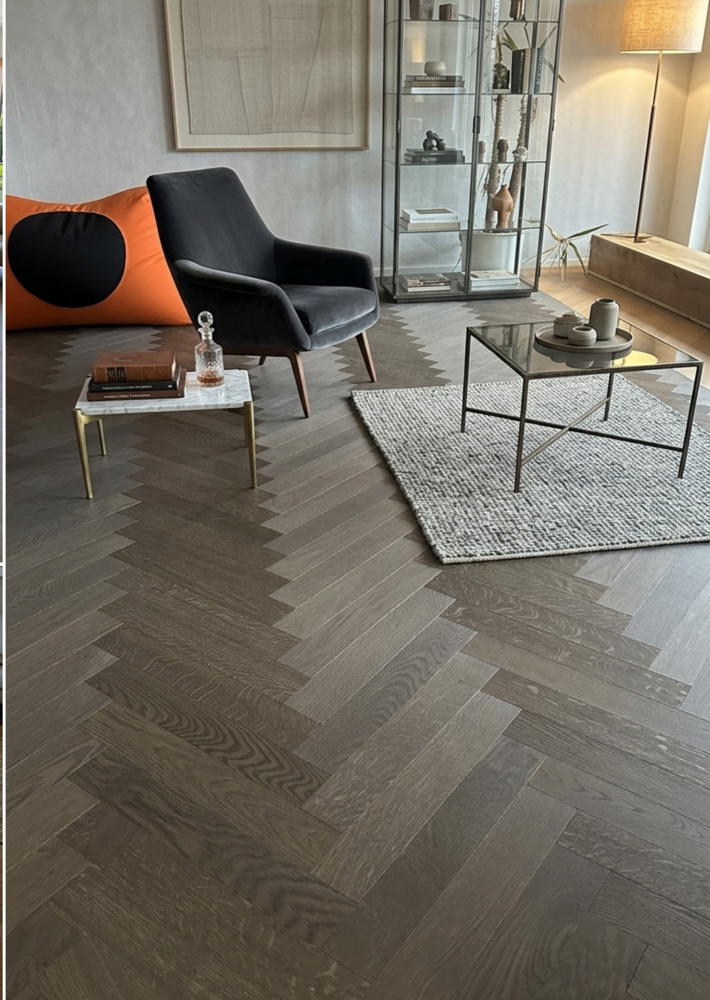
links unten: Top-Line 540 Eiche Natura oxydativ geölt