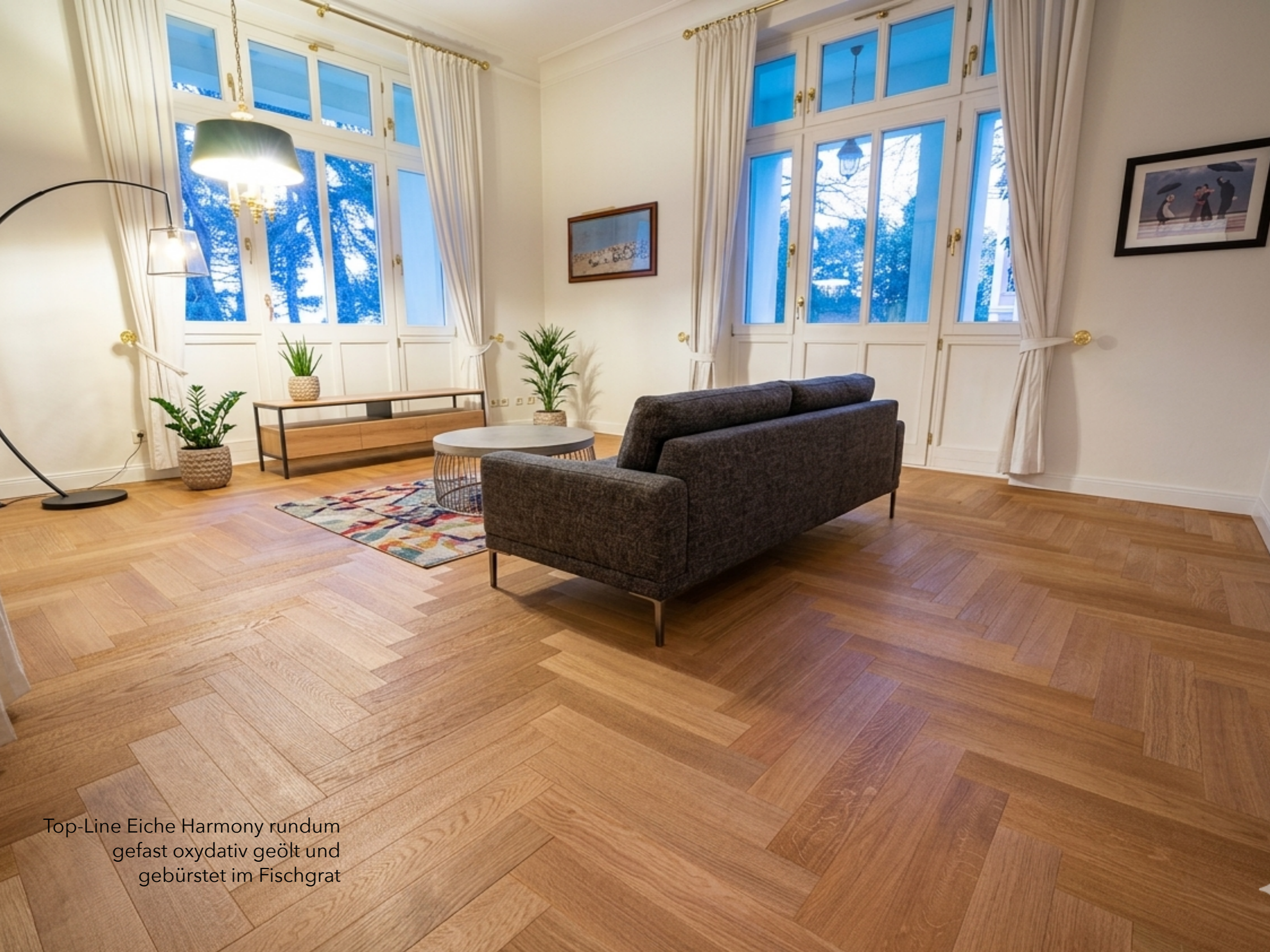
Top-Line Eiche Harmony rundum gefast oxydativ geölt und gebürstet im Fischgrat