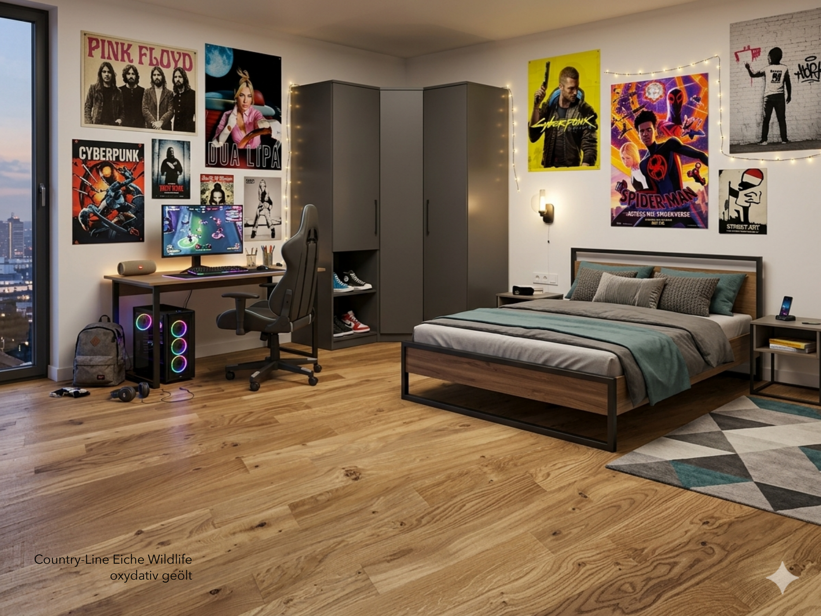
Country-Line Eiche Wildlife oxydativ geölt