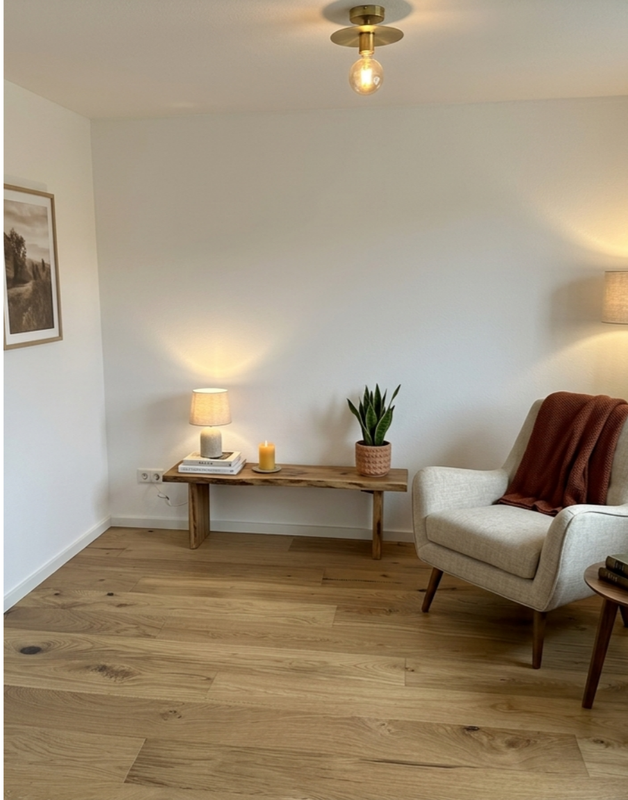
rechts: Amadeus Eiche Rustic oxydativ geölt